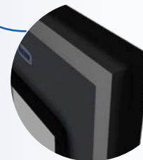
Burlete perimetral de goma elastomerica de alta resistencia.