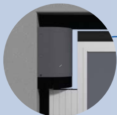
Cubre bisagra superior en ABS, similitud color puerta.