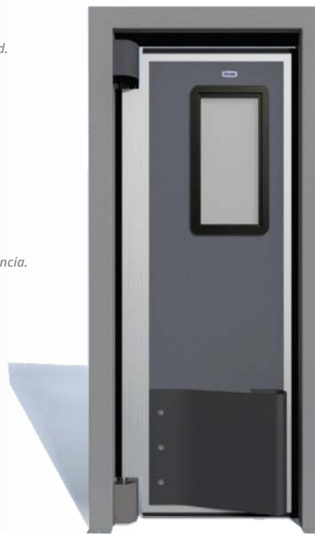
*Imagen referencial Puerta ABS Alto Tráfico una hoja.