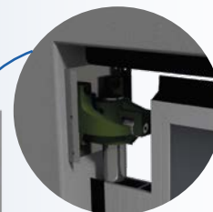
Bisagra de eleva en V. Accionamiento por gravedad.