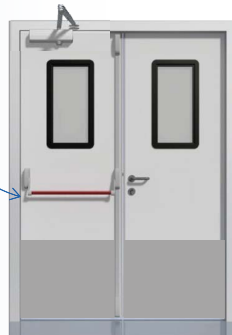
*Imagen referencial Disponibilidad 1 o 2 hojas