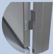
Bisagras de aluminio, libres de mantención.