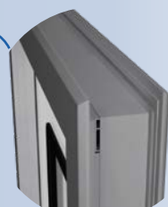
Marco ajustable a distintos espesores muros